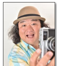
中井精也 (鉄道写真家)