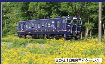
ながまれ海峡号イメージ/H

「ながまれ」とは、道南地域の懐かしい方言で「ゆっくりして」「のんびりして」という意味です。外観は函館山の稜線に、津軽海峡に煌めく漁り火、沿線の街の灯り、夜空に浮かぶ4つの星座が描かれております。また、テーブルには道南の名産「道南杉」が使用され、今回のイベントでは、車内で食事を楽しめるようテーブルやヘッドレストに設置した特別仕様としてご利用いただけます。