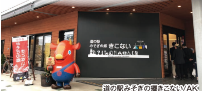
道の駅みぞぎの郷きごないWAK