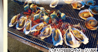
いさりびBBQイメージ

往路の車内で予約販売も行っております。木古内駅に到着後、「道の駅みぞぎの郷 きごない」内のお店でお支払いの上、商品をお受け取りいただけます。