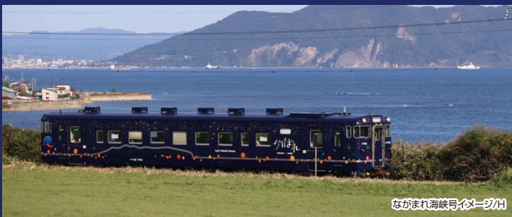
ながまれ海峡号イメージ/H