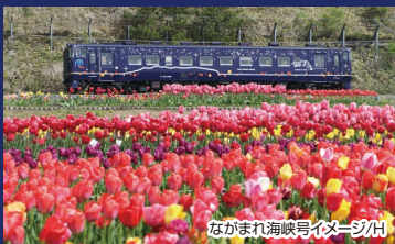
ながまれ海峡号イメージ/H