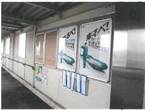
※画像は七重浜駅です。

七重浜駅・上磯駅・・・通勤通学など沿線利用者（特に高校生が目立ちます）が多く利用します。