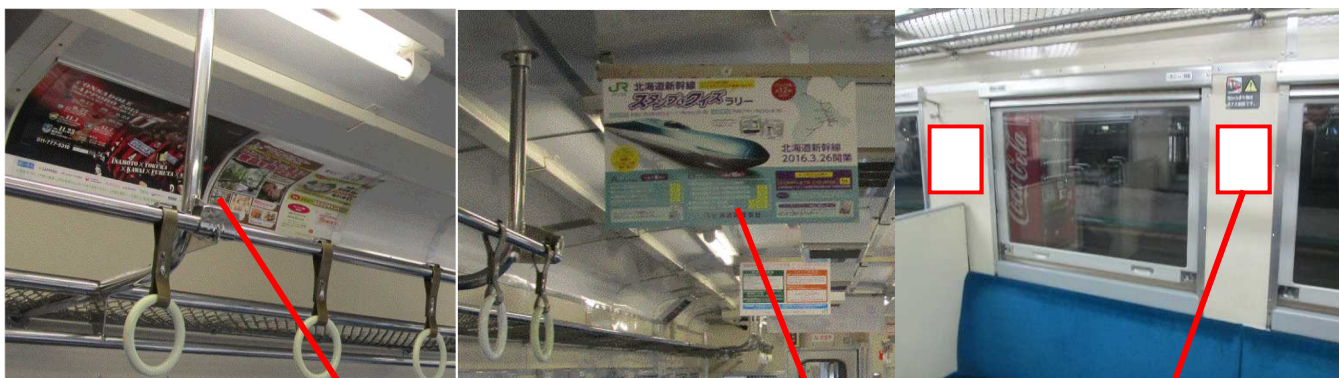
吹寄せステッカー