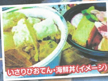
いさりびおでん・海鮮丼(イメージ)