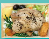
洄瀾馬告雞排便當