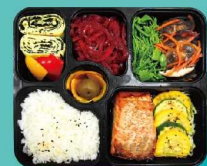
日式香烤鮭魚便當

每一年的鐵路便當節，來自各地的參展業者也是民眾另一種引頸期待的美好，除 了深受民眾喜愛的日本13家鐵道業者、歐洲的瑞士冰河列車、法國白朗峰列車，更 有號稱印度半島的一滴眼淚—斯里蘭卡鐵道，除帶來各式精彩、美味的鐵路便當 外，更將鐵道特色商品一併呈現，現場還安排令人驚喜的各國鐵道文化體驗趣味 遊戲。2019年的第5屆鐵路便當節將蒐羅各種移動的美好一次呈現，絕對引爆續 紛的鐵道熱潮，還有更多美好關係更多等著你來鐵路便當節現場親身玩味。